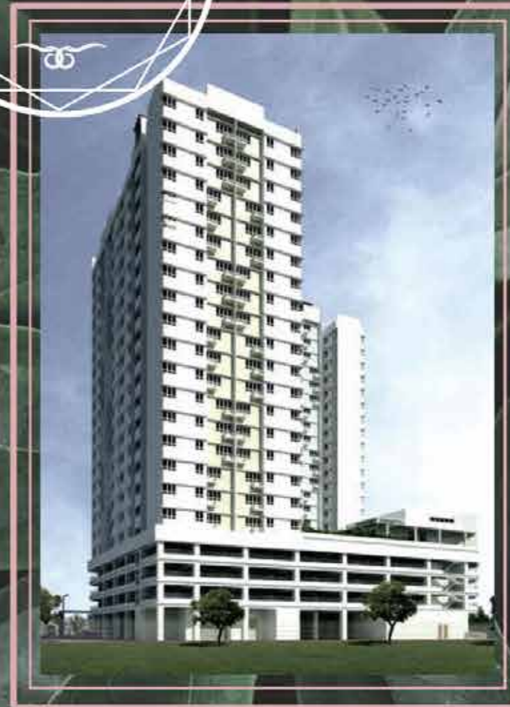
APARTMEN | 252 UNIT