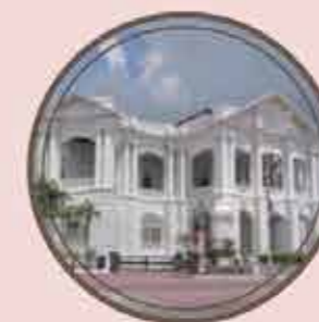
BANDAR IPOH 3 KM