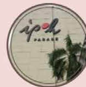
IPOH PARADE 2 KM