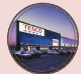
PASARAYA TESCO 5 KM