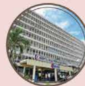
HOSPITAL PERMAISURI BAINUN 1 KM